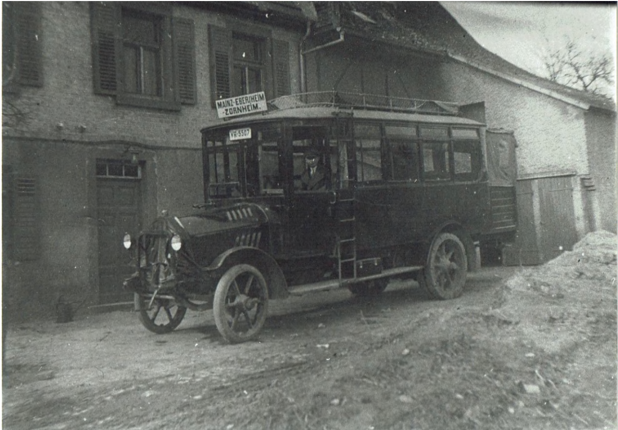
Linienbus (Mainz - Ebersheim - Zornheim) am Marienborner Weg