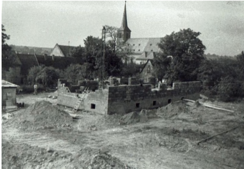
Bau der Lehrerwohnung