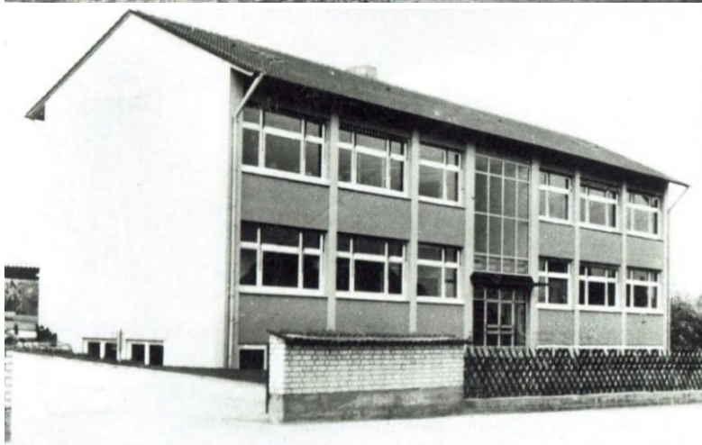
1964 Das Schulgebäude ist fertiggestellt