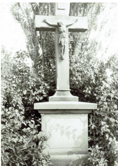
Foto von J. Blumers um 1984 noch mit Kupferkorso (rechter Fuß ist über linkem, geballte Fäuste)