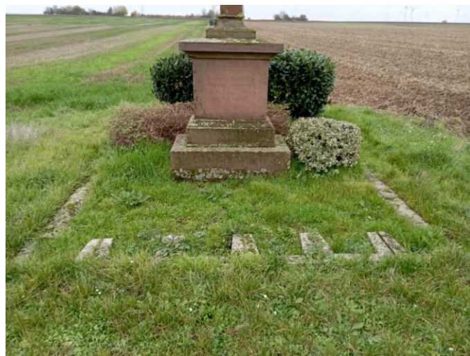
Bilder von 2023/2024 (Christusfigur linker Fuß über rechtem, offene Fäuste)

Das Kreuz steht heute rechts der L413 (von Ebersheim kommend „Nieder-Olmer Straße“, von Nieder-Olm kommend „Ebersheimer Straße“) auf Nieder-Olmer Gebiet.