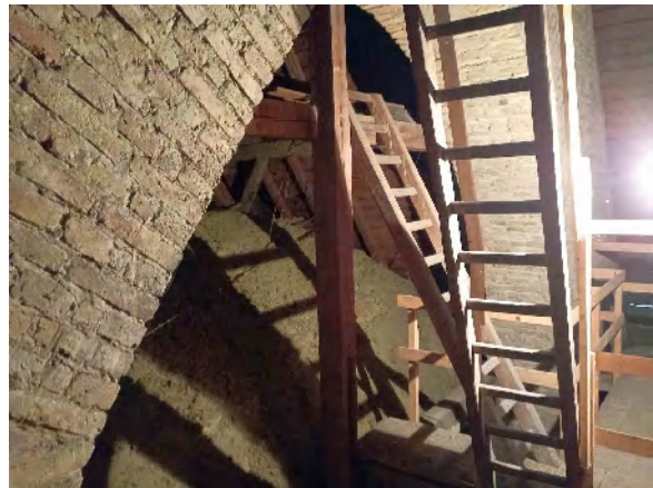
Vier Bilder vom Dachgeschoss: