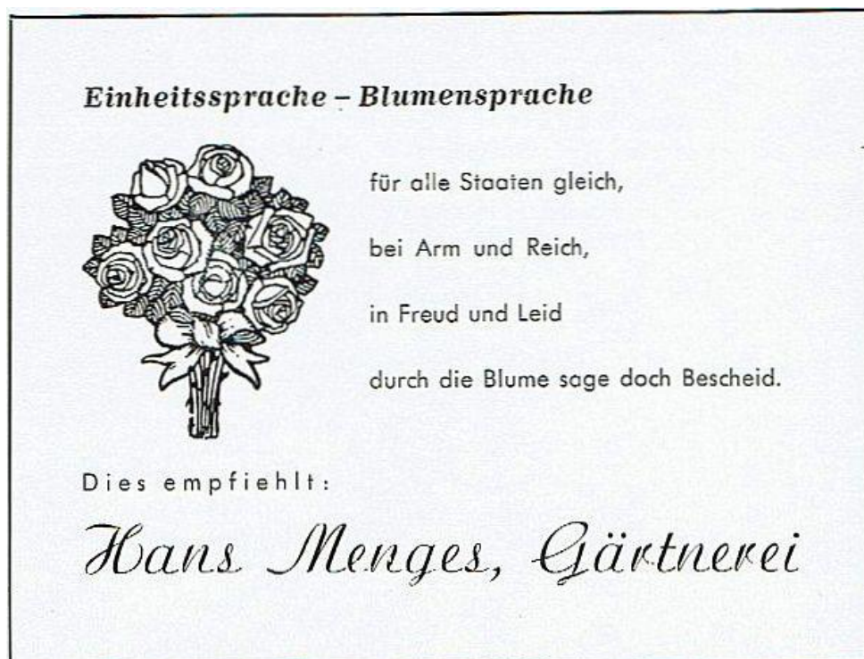
Anzeige Gärtnerei Menges 1500 Jahre Ebersheim, 1964