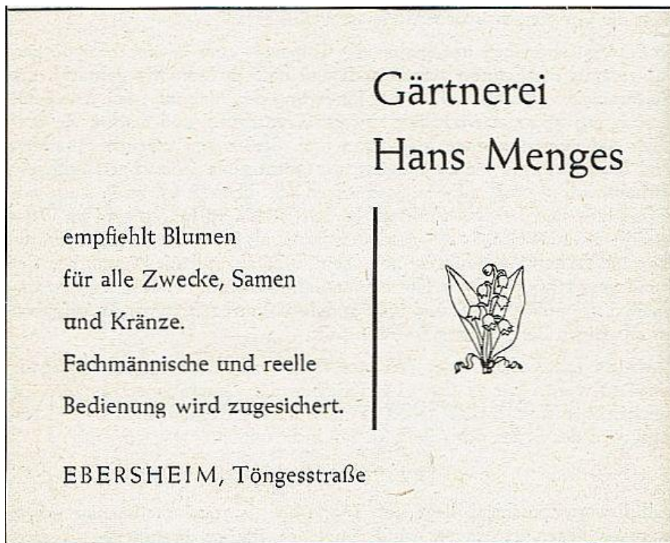
Anzeige Gärtnerei Menges Festschrift 100 Jahre Sängervereinigung Ebersheim, 1963