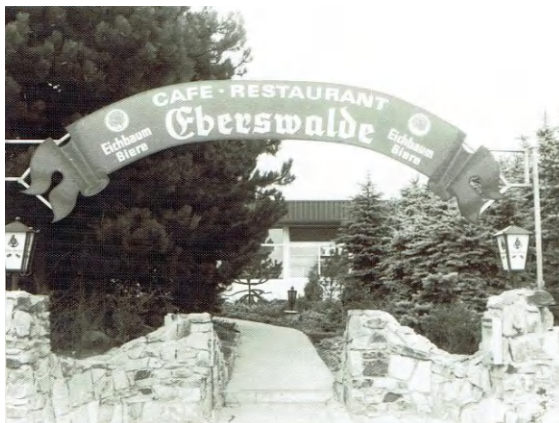
Eingang Cafe Eberswalde von der Töngesstr. aus