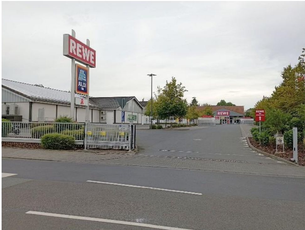
Einfahrt zum Einkaufszentrum von der Töngesstraße aus (2023)